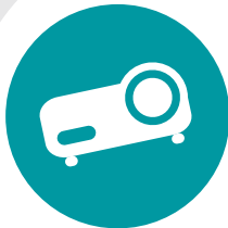
Un projecteur Epson PowerLite Home Cinema 720

Recevez une lampe pour projecteur PowerLite Home Cinema 720 (V13H010L39) par la poste Valeur de 429 $